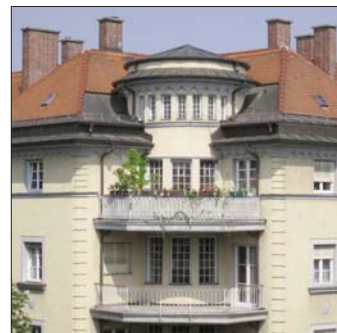
Prunkbalkon Implerstraße 60

auf unseren Zwetschgendatschi. „Aha, alles Gute kommt von oben“, rief meine Mutter erstaunt. Sogleich erschall von oben eine belehrende Stimme: