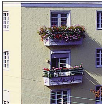
Zierbalkon Ansprengerstraße 1

Balkone gibt es in vielfältigen Ausführungen vom französischen Balkon, einer Fenstertüre mit einem Gitter davor, über den kleinen Austritt bis hin zum richtigen Balkon, auf dem im Idealfall ein Tisch und ein paar Stühle