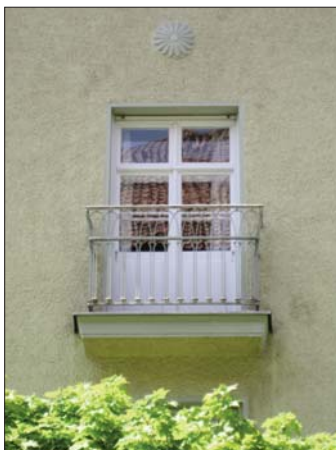
Französischer Balkon Rossinistraße 3

Seinen Name entlehnten wir im 18. Jahrhundert aus dem französischen Wort „balcon“.