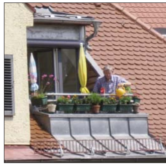
Sonnen- und Blumenbalkon Geibelstraße 4

Balkone gibt es in vielfältigen Ausführungen vom französischen Balkon, einer Fenstertüre mit einem Gitter davor, über den kleinen Austritt bis hin zum richtigen Balkon, auf dem im Idealfall ein Tisch und ein paar Stühle