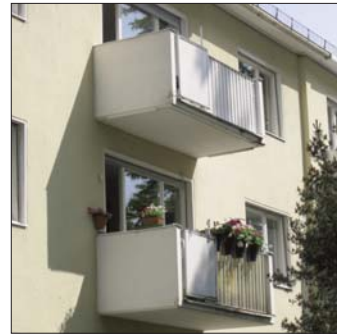
Kaffee & Kuchen-Balkon Prinzenstraße 77

Ein weiteres Unterscheidungskriterium ist die Nutzung. Dazu erinnere ich mich an eine