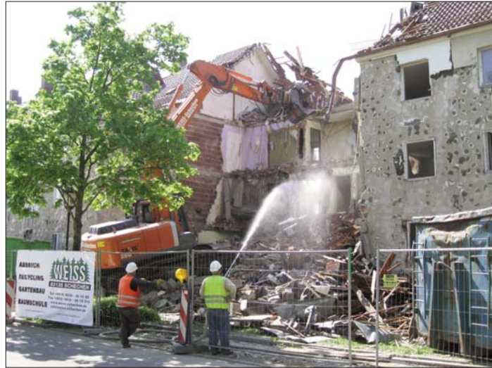
Abgewohnt und ausgedient: Der Wohnblock an der St.-Konrad-Straße in Haar wurde im Frühjahr endlich abgerissen

ten sich die Mieter sogar ein Bad teilen. Umbauten in der Folgezeit haben schon damals Kompromisse verlangt und die Grundrisse nicht unbedingt verbessert. Es gab viele Durchgangszimmer und nach wie vor kleine, enge Kochküchen.