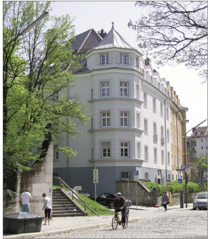
Ein Blickfang in exponierter Lage: Eingebettet zwischen Hoch- und Ruhestraße strahlt das Haus in neuem Putz

Auch sonst hat das Haus eine Verjüngungskur erhalten, verschrieben von der Energieeinsparverordnung (EnEV). Bereits 2009 ließ der bww den Speicher isolieren, inaktive Kamine abbrechen und eine Rauch- und Wärmeabzugsanlage einbauen. Außerdem wurde das Dach komplett neu eingedeckt und mit neuen Gauben versehen. Im vergangenen Jahr erhielt nun die Fassade Vollwärmeschutz durch Anbringen des schon bewährten Wärmedämmverbundsystems: Nach Abtragen des alten Putzes wurden 14 Zentimeter dicke Platten aus extrudiertem Polystyrolschaum am Gemäuer angebracht, auf diese kamen eine Armierungsschicht aus Glasfaser