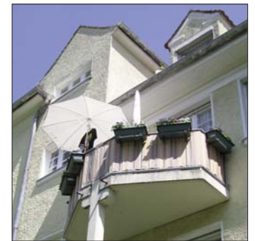
Nachträglich angebauter Balkon Kreittmayrstraße 33

In der Tat finden sich beim bww die vielfältigsten Nutzungsarten: Blumenbalkone, Ratschbalkone, Kaffee & Kuchen-Balkone, Sonnenanbeterbalkone, Biertragbalkone, vernachlässigte Tauben-